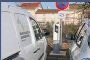
P7 MOBILITÉ ÉLECTRIQUE Un bilan très encourageant