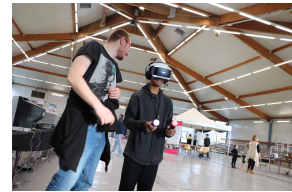
Metuentes igitur idem latrones