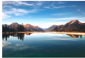
Quaestione igitur per multiplices dilatata