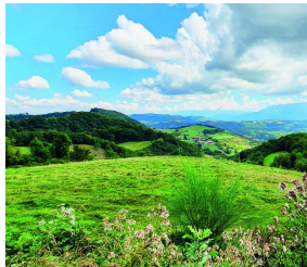
Iam in altera philosophiae parte