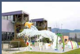
P9 OLYMPIDE De nouveaux aménagements