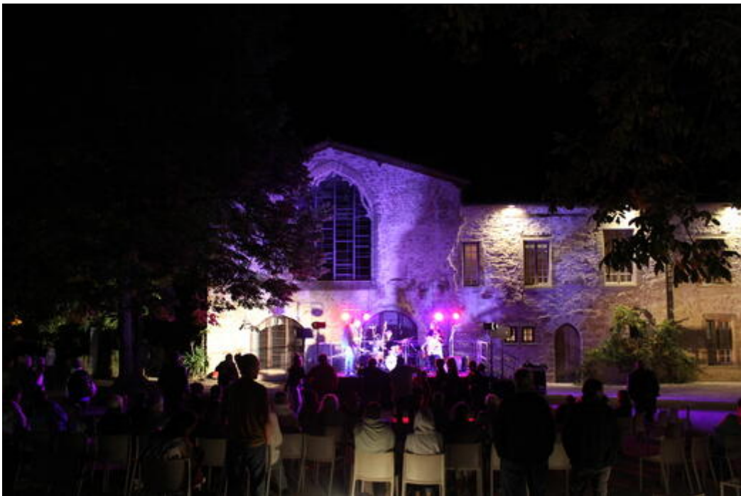
La légende de l'image