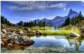
Legende nec usu nec ratione habent

Iam in altera philosophiae parte. quae est quaerendi ac disserendi, quae logikh dicitur, iste vester plane, ut mihi quidem videtur, inermis ac nudus est. tollit definitiones, nihil de dividendo ac partiendo docet, non quo modo efficiatur concludaturque ratio tradit, non qua via captiosa solvantur ambigua distinguantur ostendit; iudicia rerum in sensibus ponit, quibus si semel aliquid falsi pro vero probatum sit, sublatum esse omne iudicium veri et falsi putat.