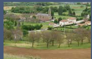
P14 CHASSELAY Porte de Chambaran