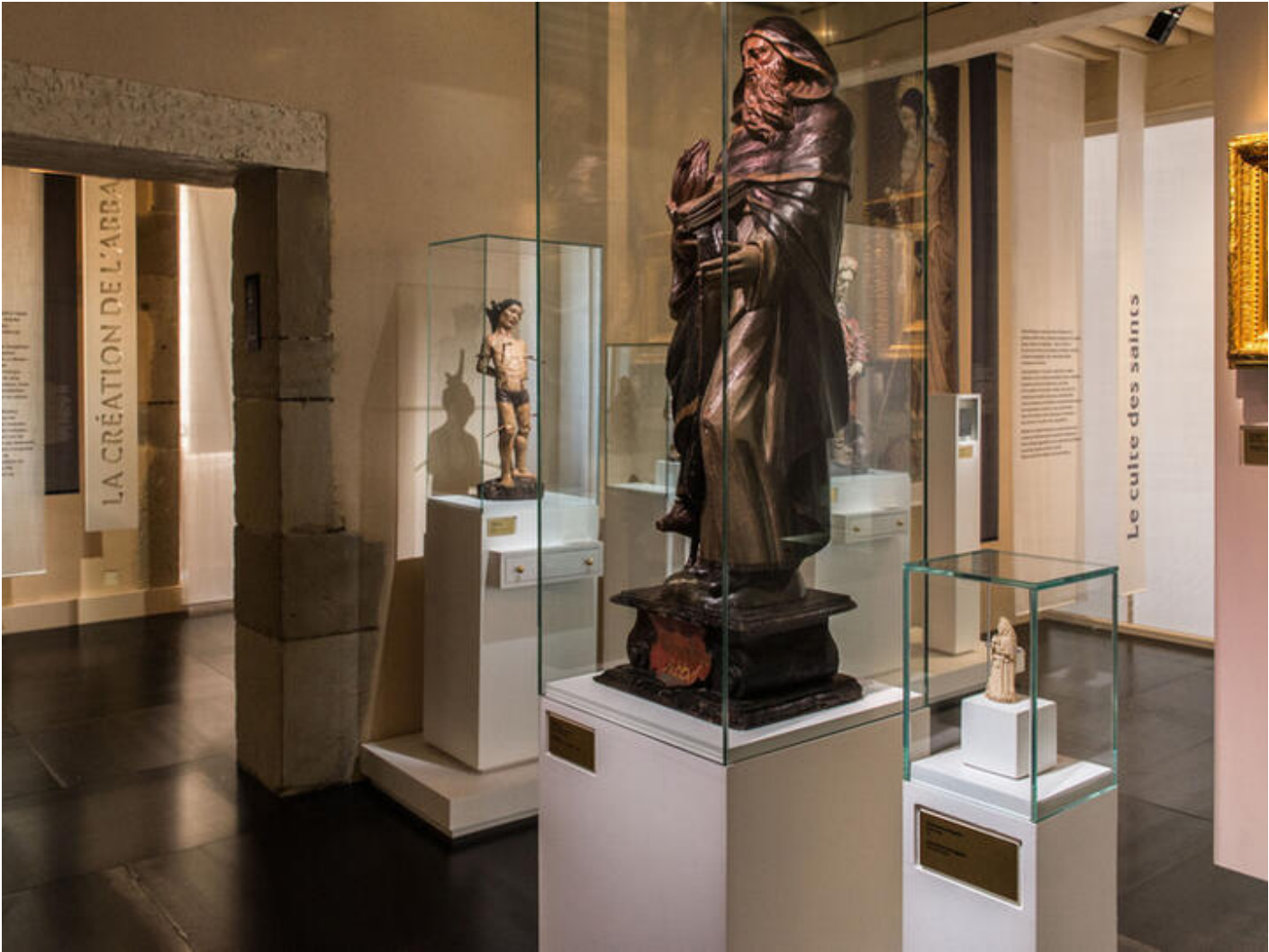
Visite guidée : Il était une fois, une abbaye au Moyen Âge 38160 Saint-Antoine-l'Abbaye sam. 19 sept. Sun 20 Sep