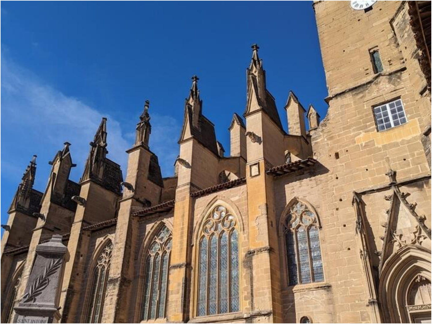
Visite flash : Trésor de l'Abbaye, souvenir d'un reliquaire 38160 Saint-Antoine-l'Abbaye sam. 19 sept. Sun 20 Sep