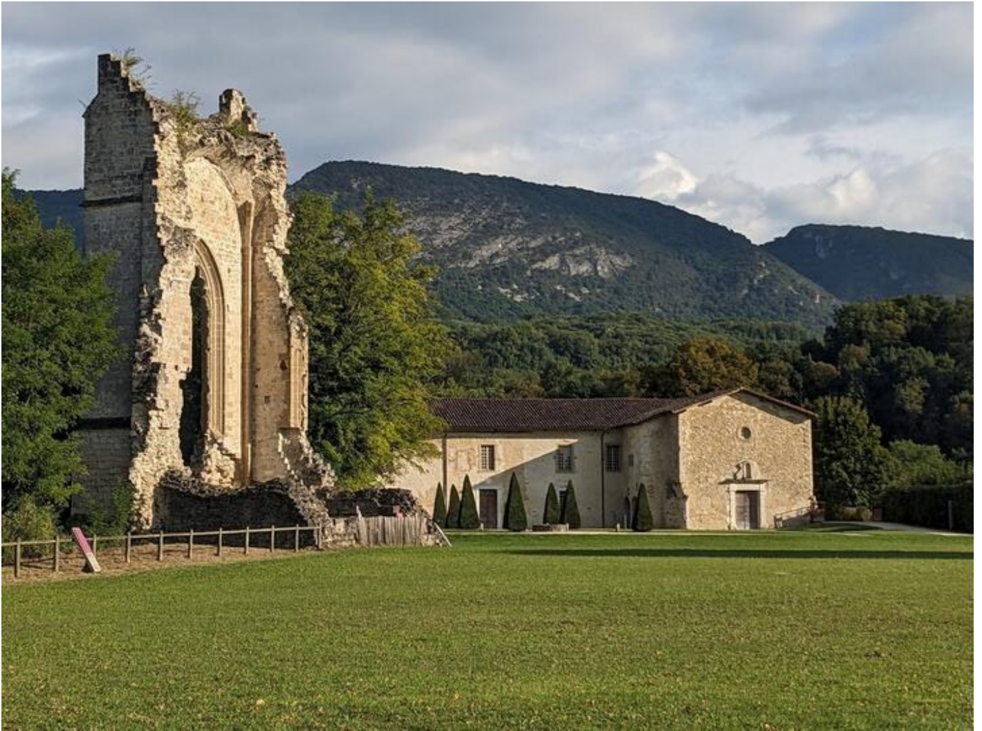
Visite guidée gustative 38160 Beauvoir-en-Royans sam. 19 sept.