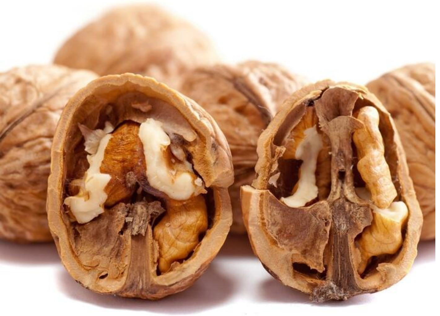
6ème marché d'automne 38470 Vinay sam. 31 oct.