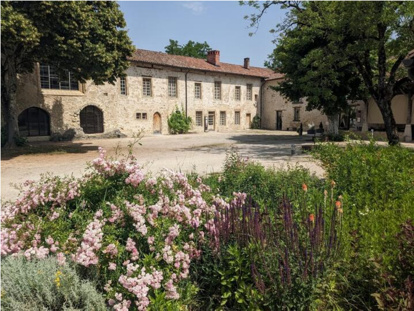
Visite Gustative 38160 Beauvoir-en-Royans sam. 19 sept. Sun 20 Sep