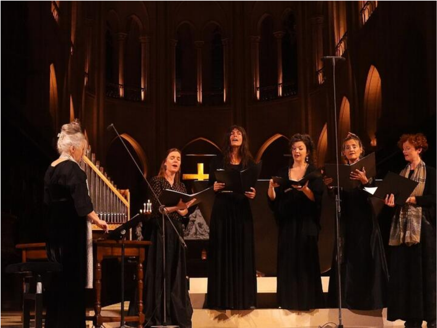
Concert Prima Vox par l'Ensemble De Caelis 38160 Saint-Antoine-l'Abbaye sam. 05 déc.