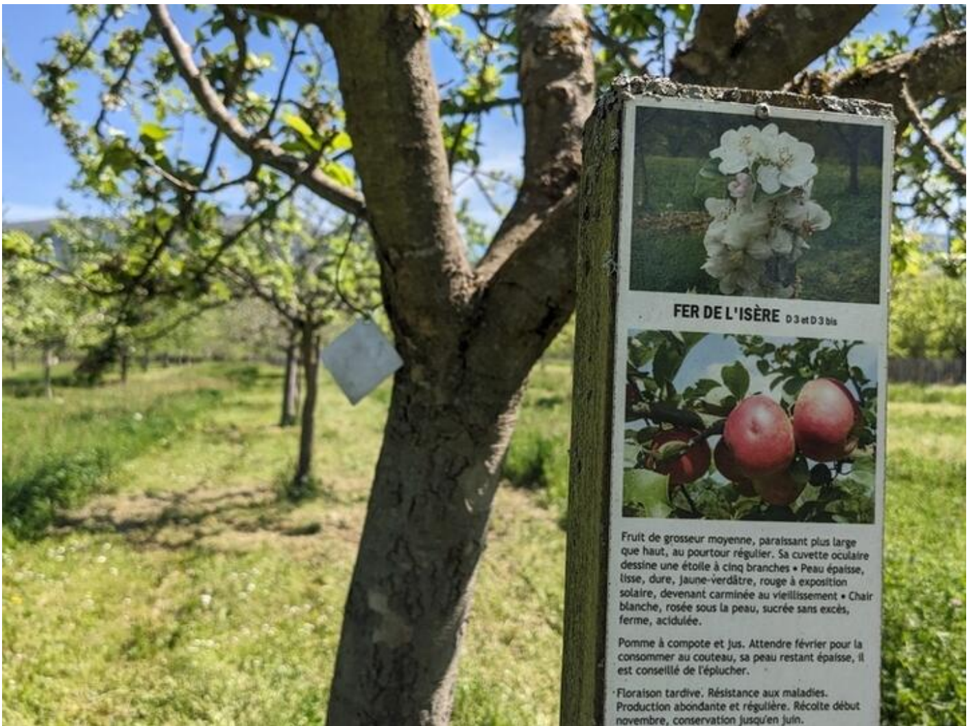
Visite accompagnée du verger conservatoire 38160 Beauvoir-en-Royans dim. 20 sept.