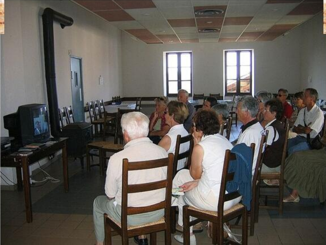
Vidéo-visite de l'intérieur du Château Prunier 38680 Saint-André-en-Royans sam. 19 sept. Sun 20 Sep