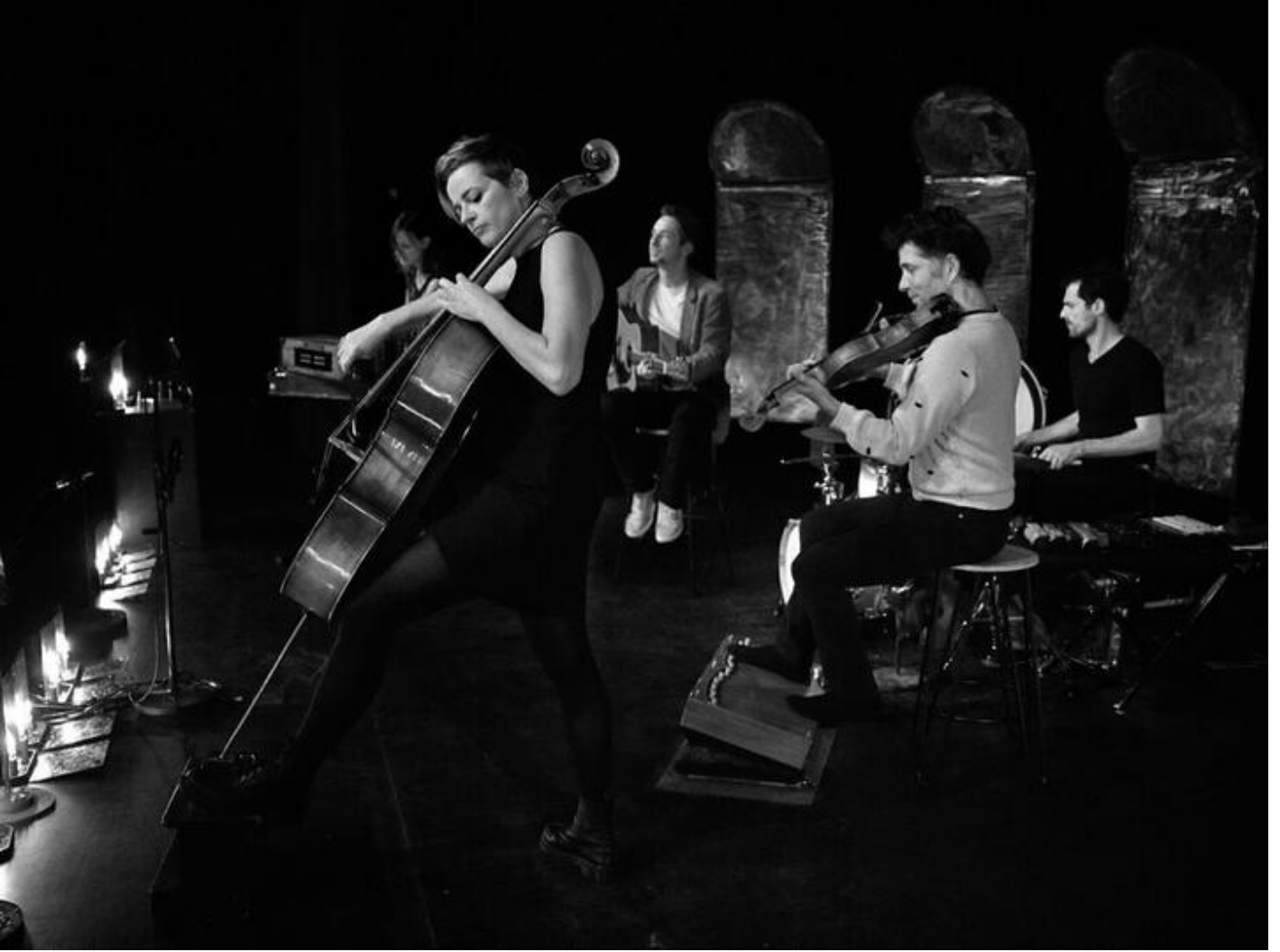
Concert 'Rangé sauvage' de No Mad 38160 Beauvoir-en-Royans dim. 04 oct.