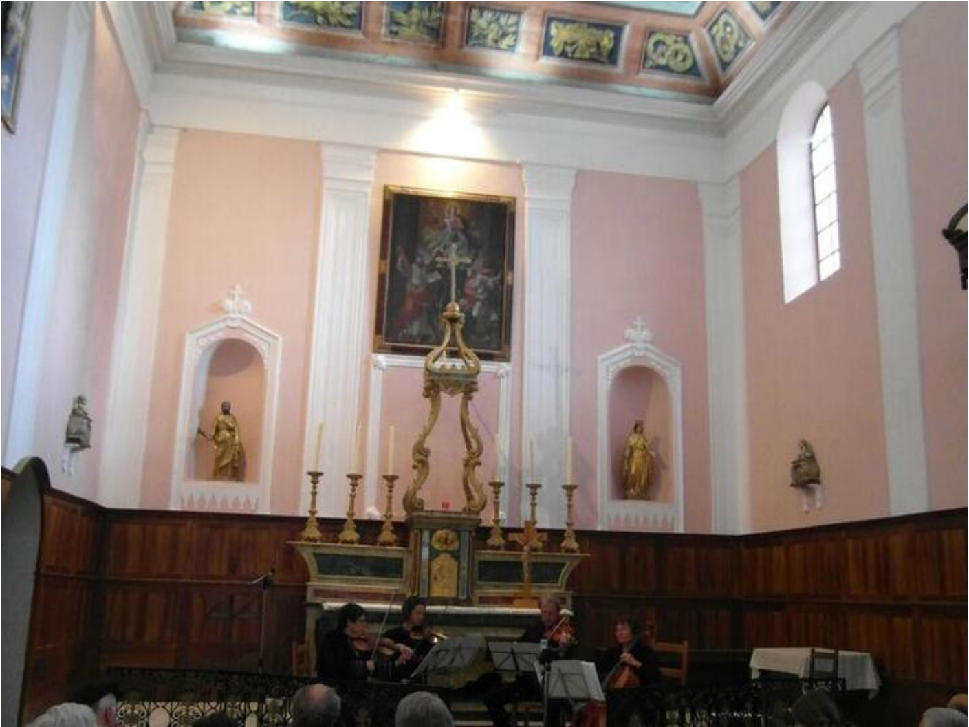
Ensemble "La Magnifique", Musique instrumentale du XVIIe dans l'Eglise de Saint-André-en-Royans 38680 Saint-André-en-Royans sam. 19 sept. Sun 20 Sep