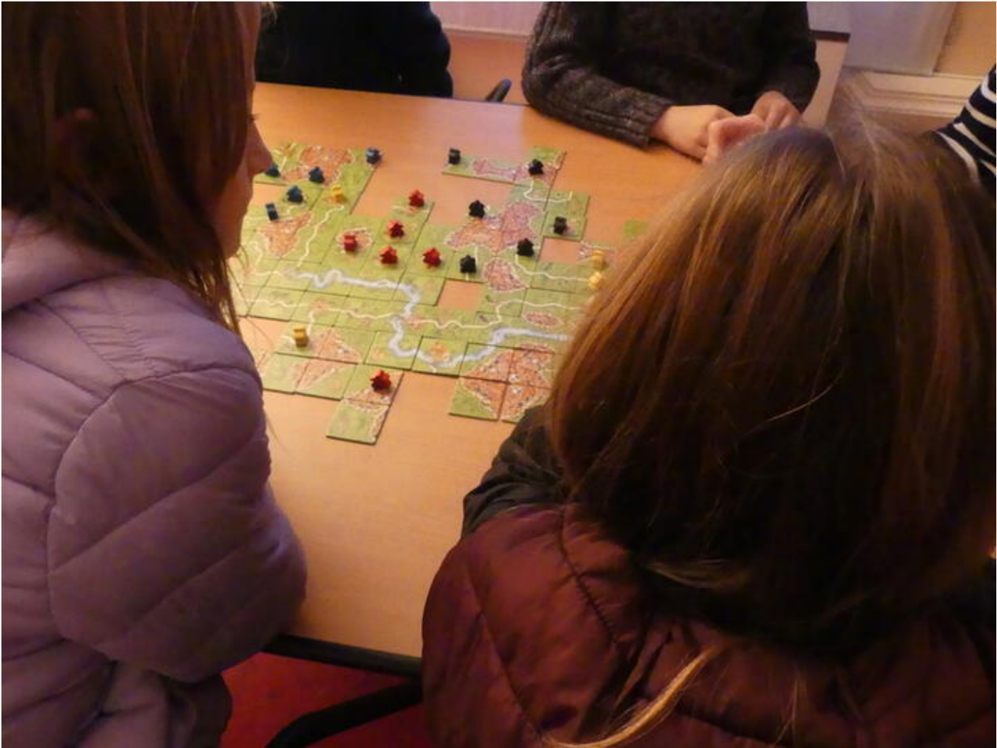
Jouons au musée 38160 Saint-Antoine-l'Abbaye sam. 21 nov.