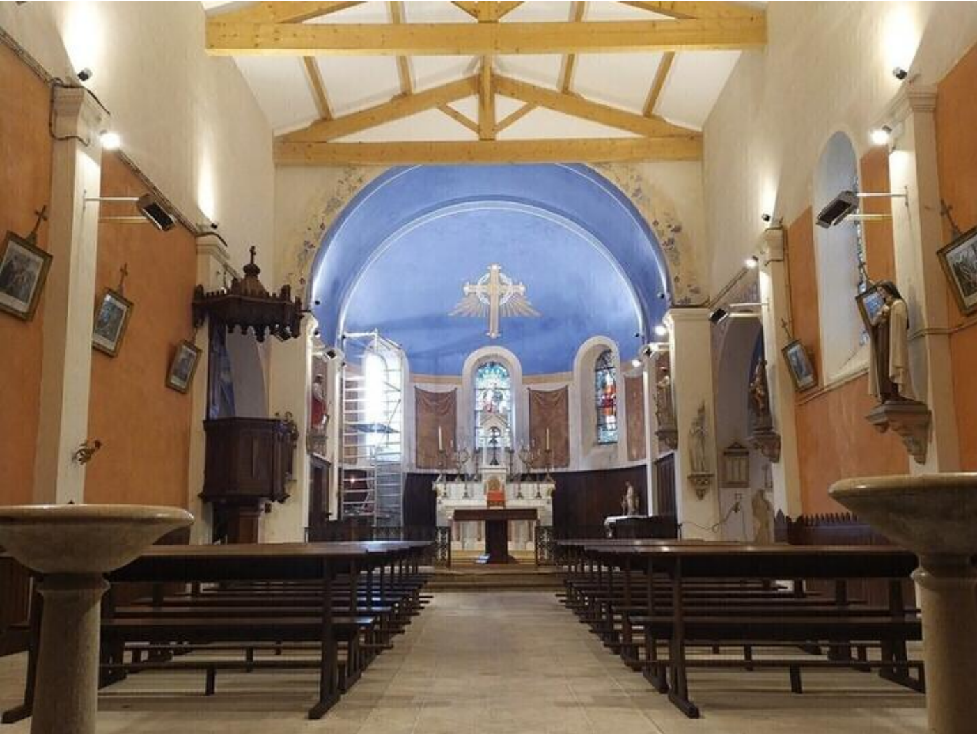
Eglise : expositions vetements liturgiques 38160 Montagne sam. 19 sept. Sun 20 Sep