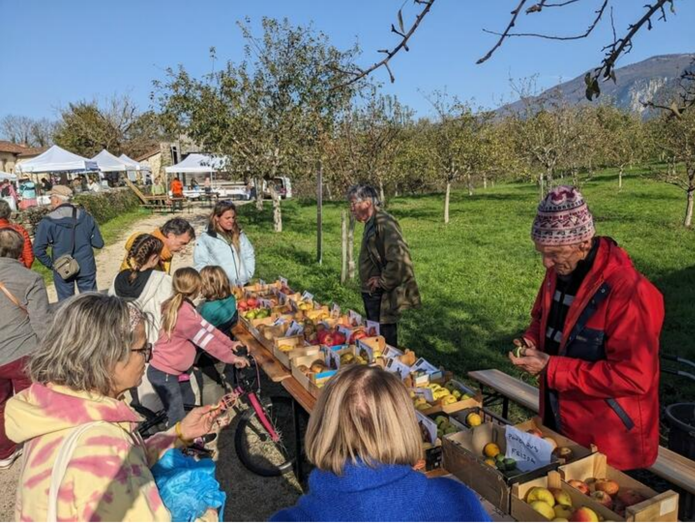
Pressée de jus et détermination des variétés de pommes du verger 38160 Beauvoir-en-Royans dim. 20 sept.