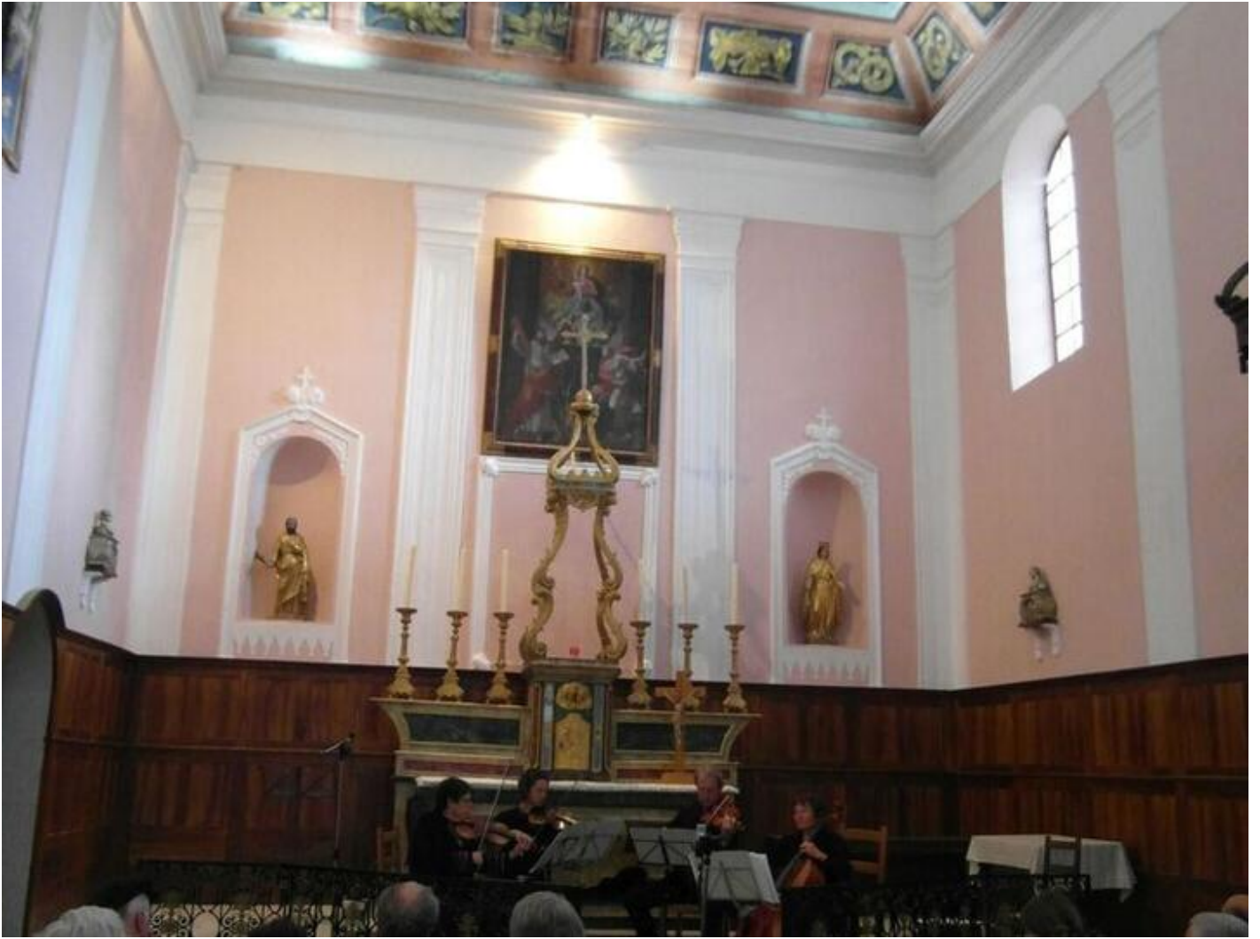
Concert "Promenade Baroque" dans l'église de St-André-en-Royans 38680 Saint-André-en-Royans dim. 20 sept.