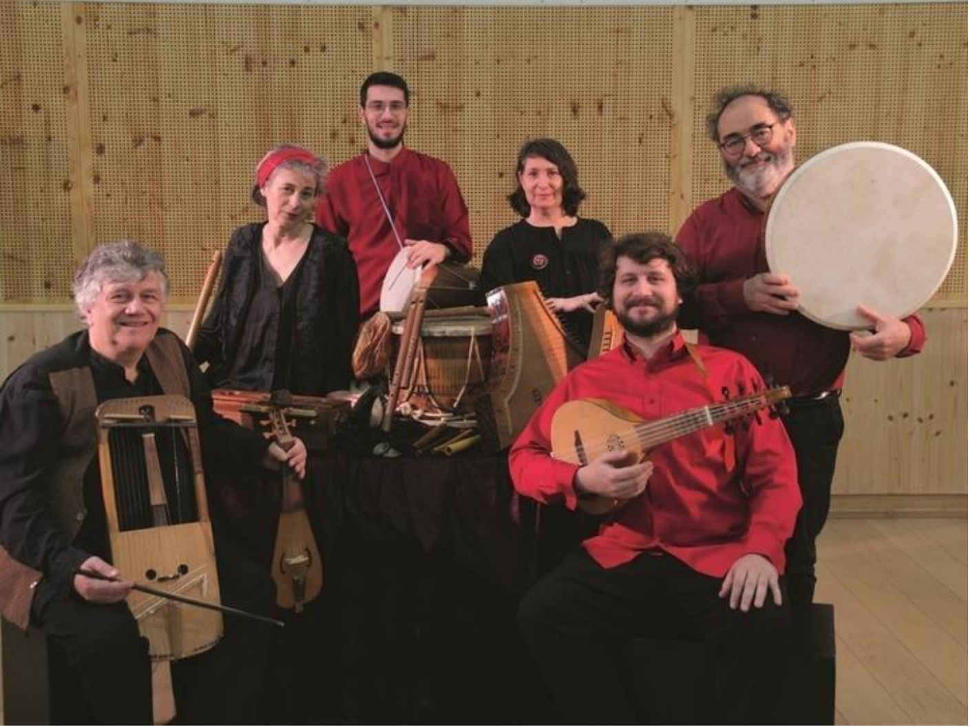
Concert inaugural : Sur le pont d'Avignon par l'ensemble Obsidienne 38160 Saint-Antoine-l'Abbaye sam. 19 sept. Sun 20 Sep