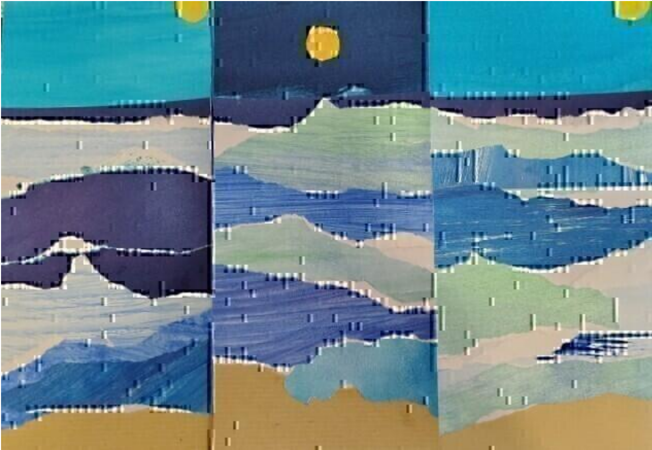
Les couleurs de l'eau . Visite et atelier jeune public 38160 Saint-Antoine-l'Abbaye dim. 25 oct.