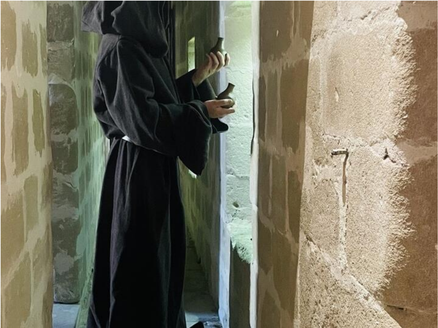
Escape game - Dans la tour de l'empoisonneur, avec Old Games 38160 Saint-Antoine-l'Abbaye sam. 19 sept. Sun 20 Sep