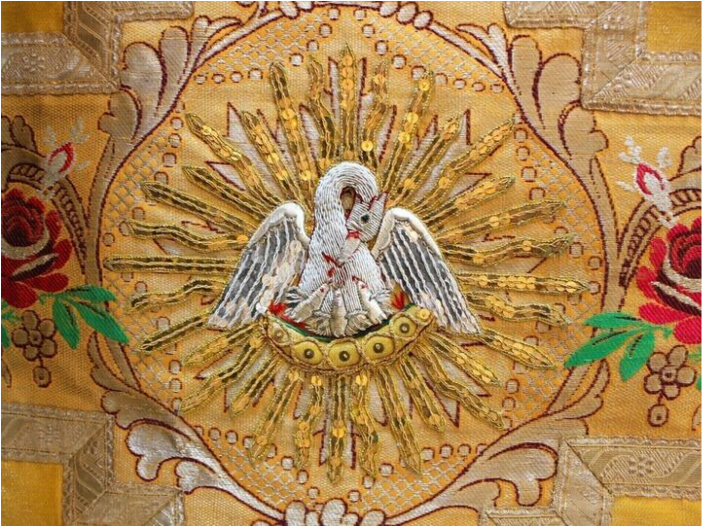
Exposition "Trésor de vêtements liturgiques" 38470 Rovon sam. 19 sept.