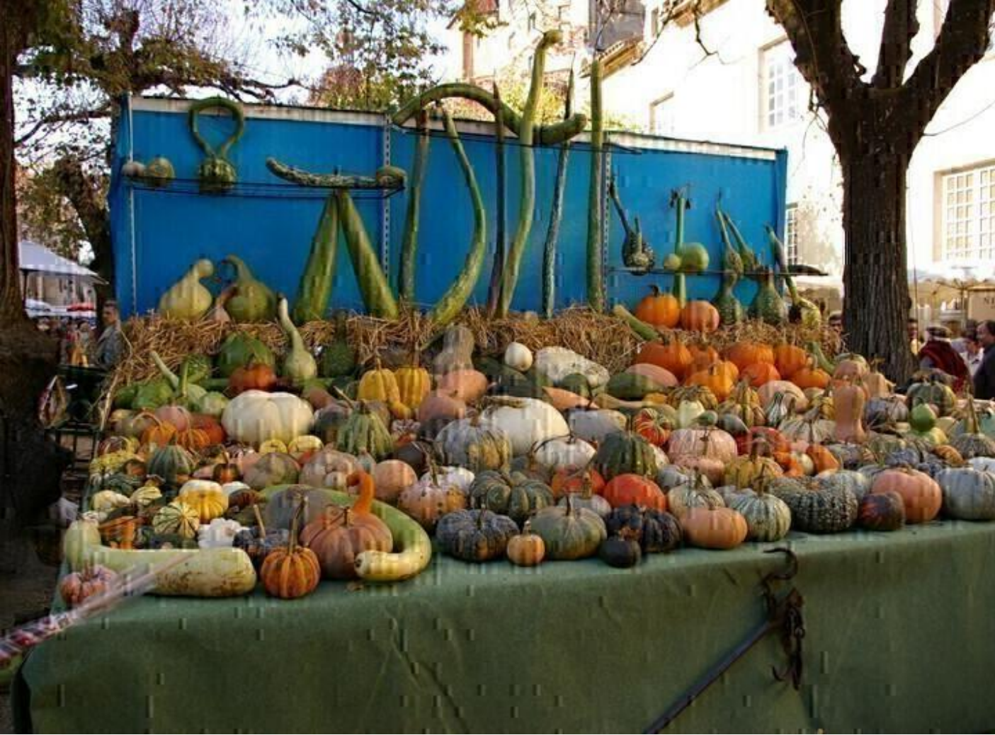
Foire à l'Ancienne | 37ème édition 38160 Saint-Antoine-l'Abbaye ven. 09 oct.