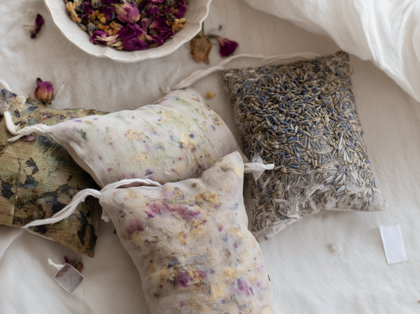
L'Automne au Jardin du Parfumeur : sérénité et sommeil : sachet parfumé aux senteurs apaisantes. 38160 Saint-Antoine-l'Abbaye dim. 04 oct.