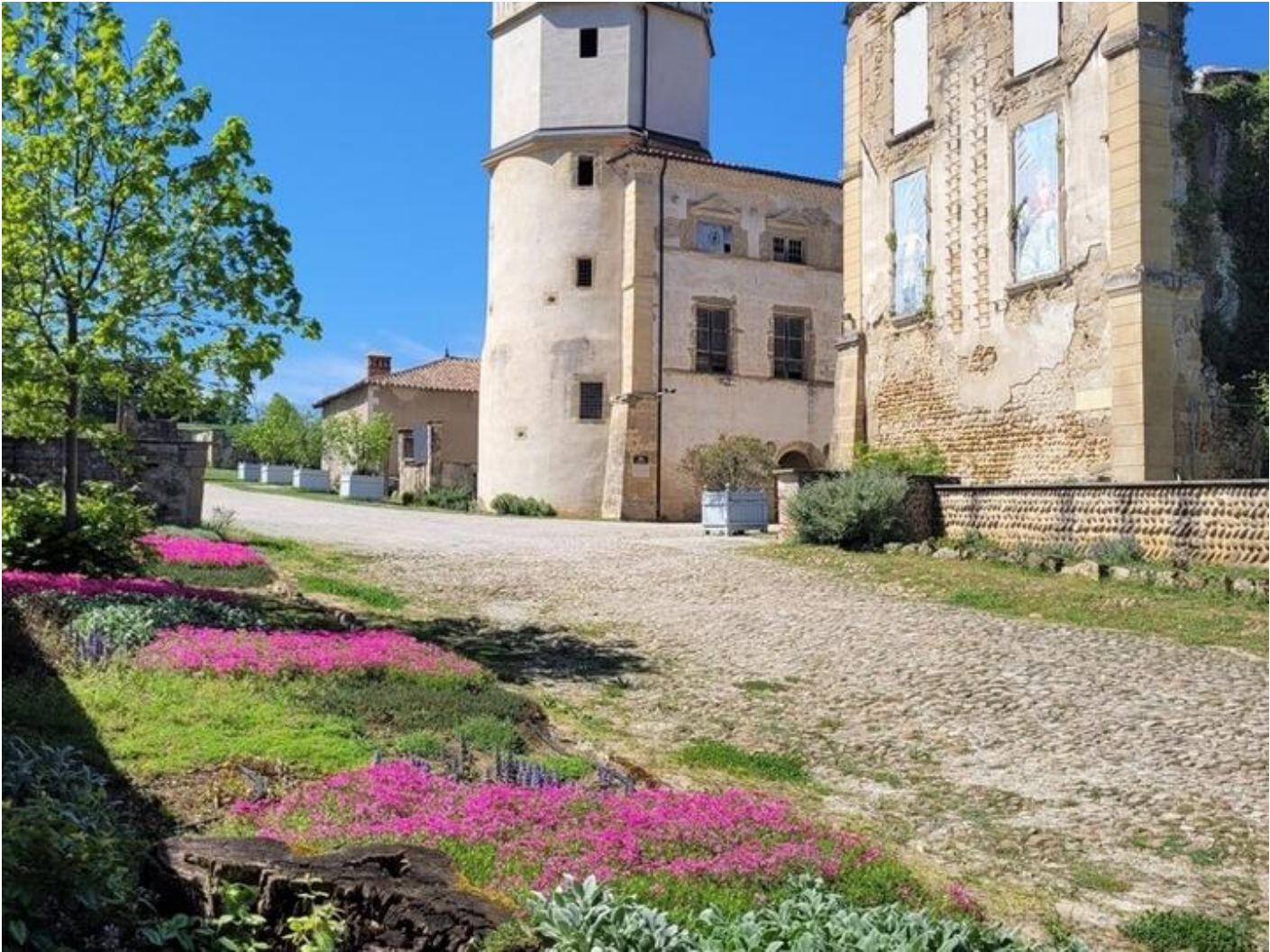
Visites commentées du Château de l'Arthaudière 38840 Saint-Bonnet-de-Chavagne sam. 19 sept.