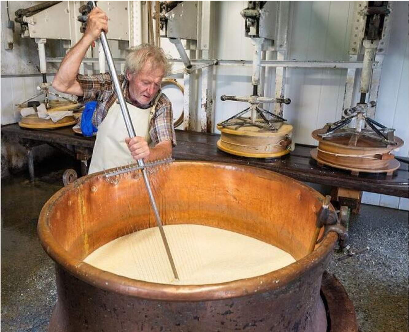
Expo photos "Fabrication du Beaufort d'alpage, au lac des Fées 38840 Saint-Bonnet-de-Chavagne dim. 20 sept.