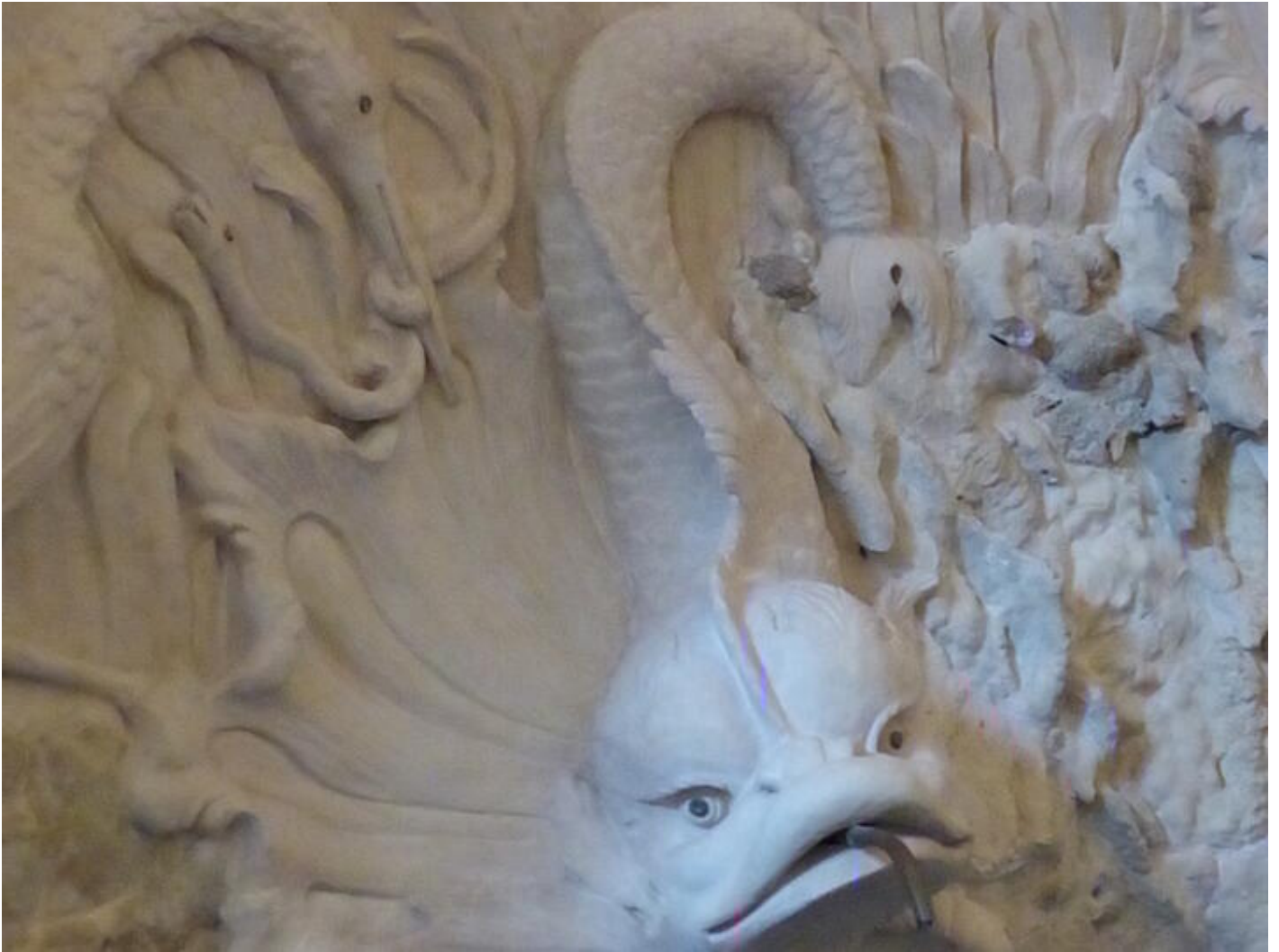
Visite guidée Saint-Antoine au fil du temps - Le temps de la curiosité : curiosités minérales ou a 38160 Saint-Antoine-l'Abbaye dim. 27 sept.