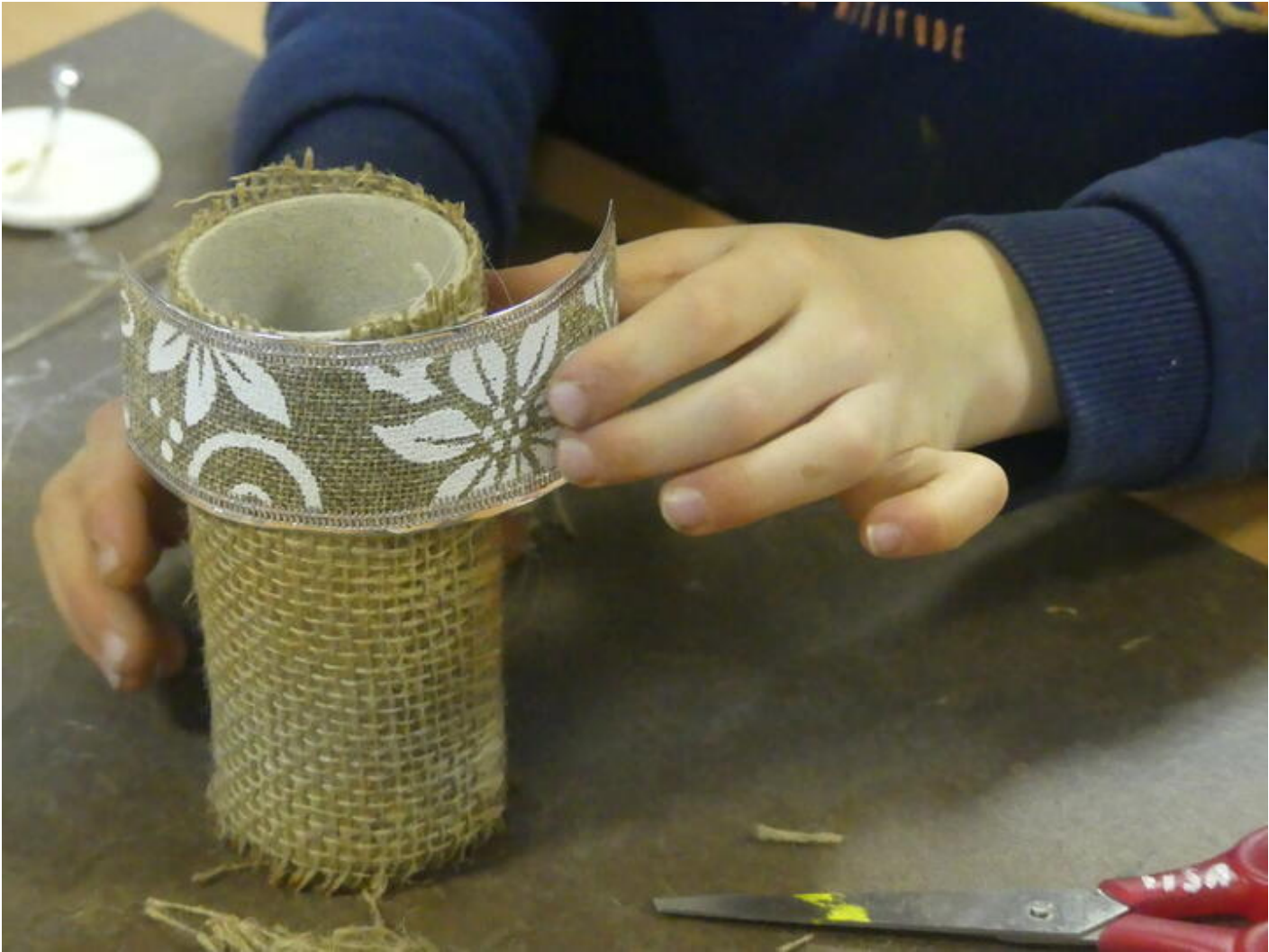
Ateliers créatifs à l'occasion de Noël au musée 38160 Saint-Antoine-l'Abbaye sam. 05 déc.