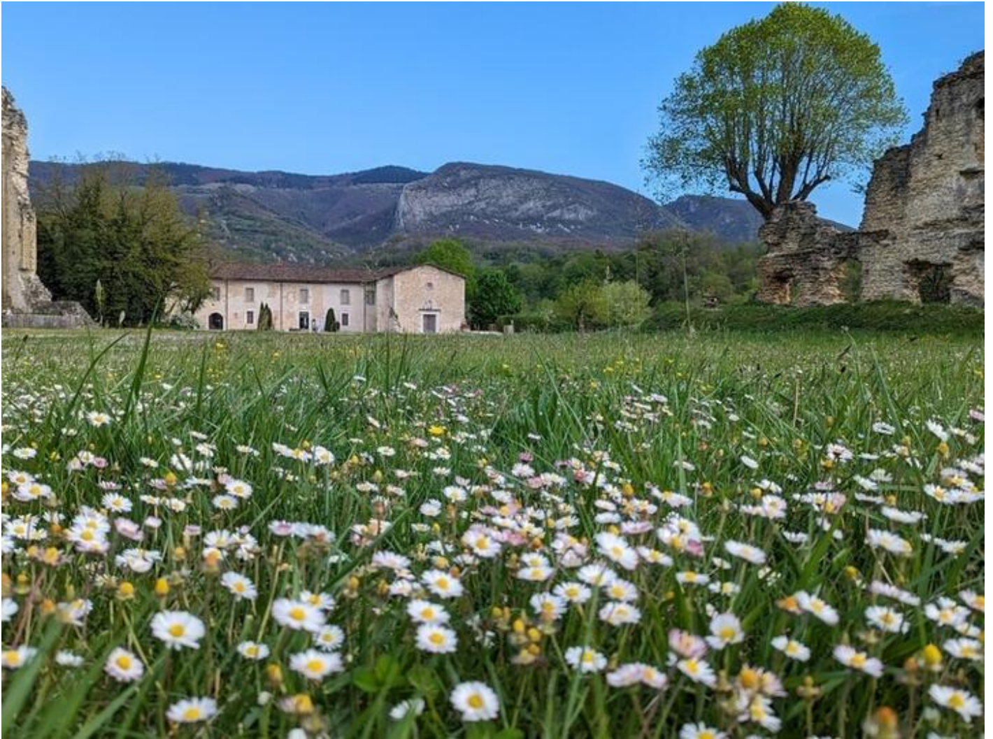
Visite Flash Couvent des Carmes ou site delphinal 38160 Beauvoir-en-Royans dim. 20 sept.