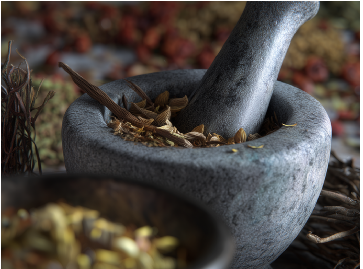
L'Hiver au Jardin des Simples : chaleur et protection : baume pectoral contre les maux d'hiver. 38160 Saint-Antoine-l'Abbaye sam. 05 déc.