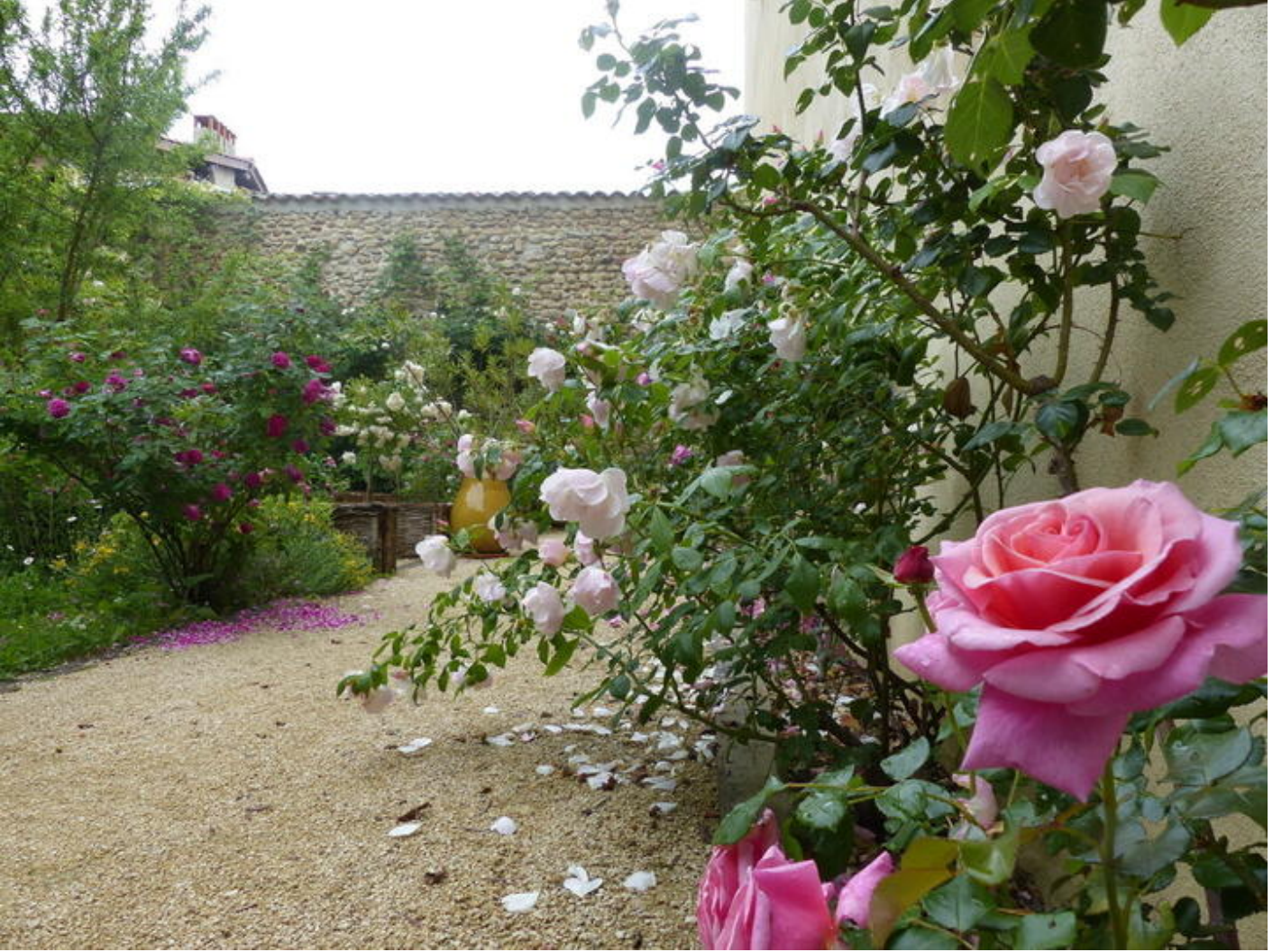
Danser le vivant : à la découverte de la rose et de la sauge 38160 Saint-Antoine-l'Abbaye dim. 15 nov.