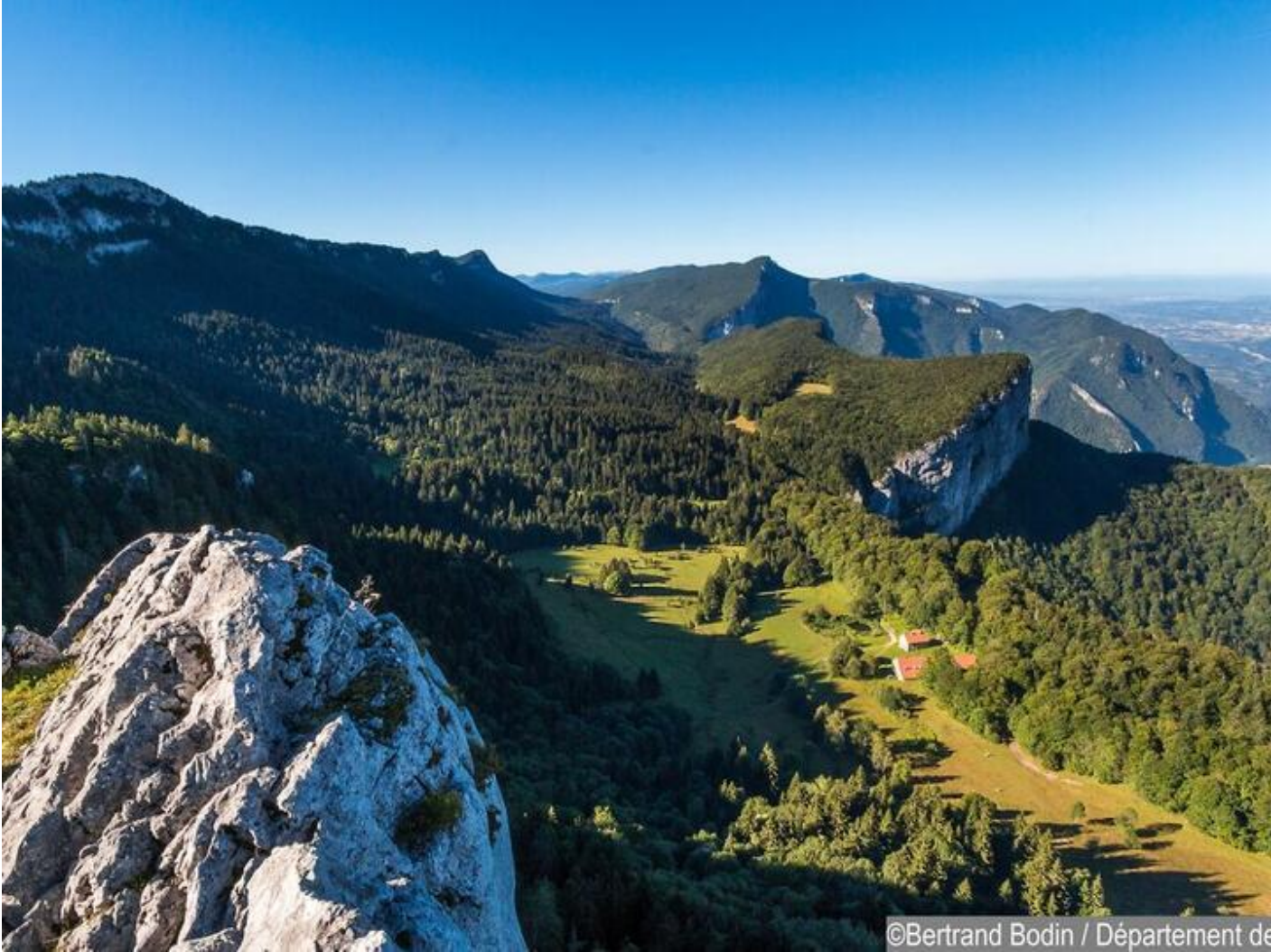
Géologie des Ecouges 38470 Saint-Gervais