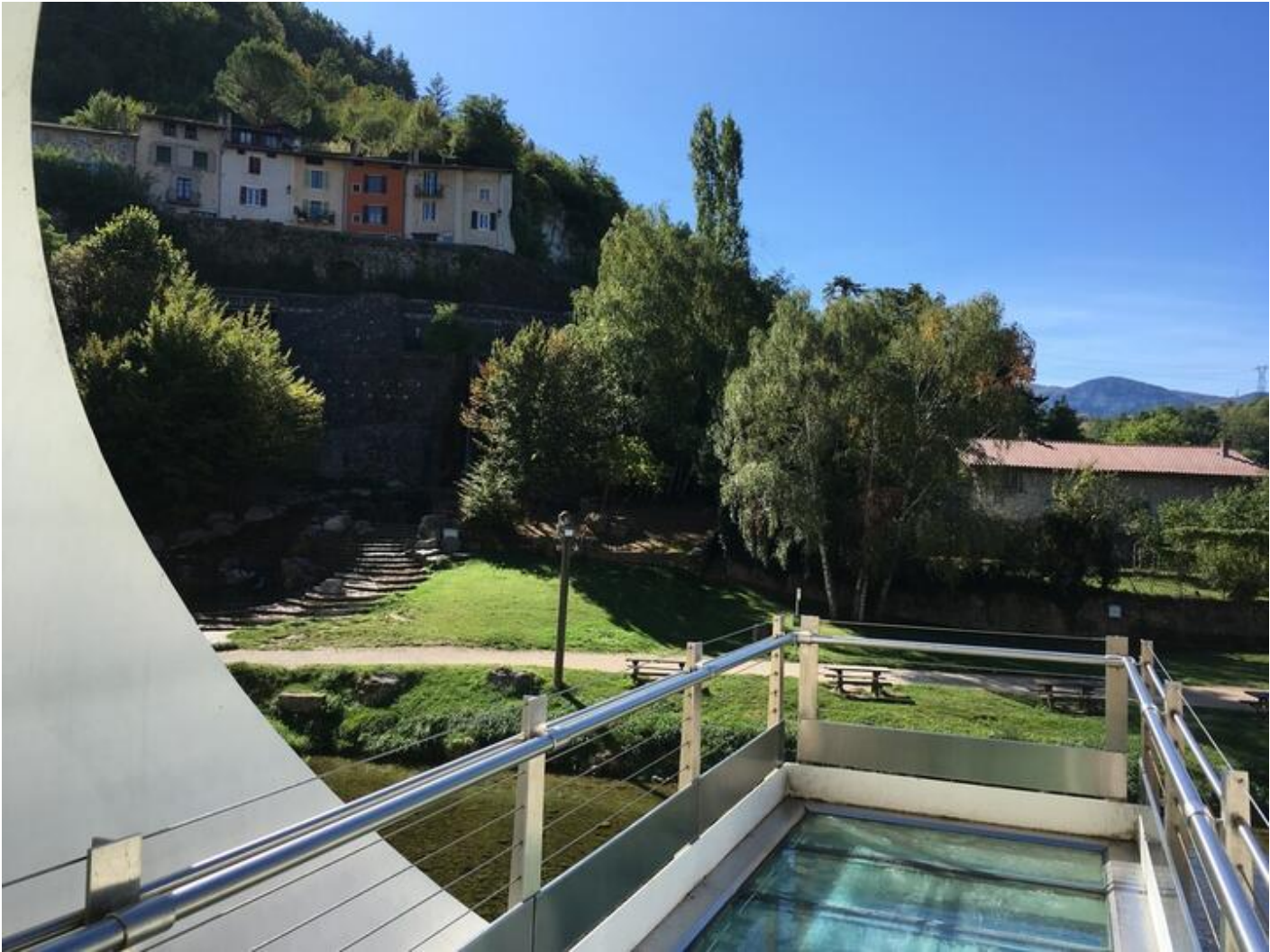
Visite du musée de l'Eau 38680 Pont-en-Royans sam. 19 sept.