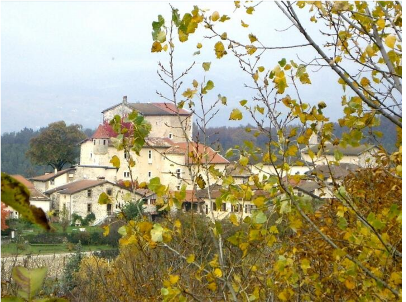
Visite du village de St-André-en-Royans 38680 Saint-André-en-Royans sam. 19 sept.