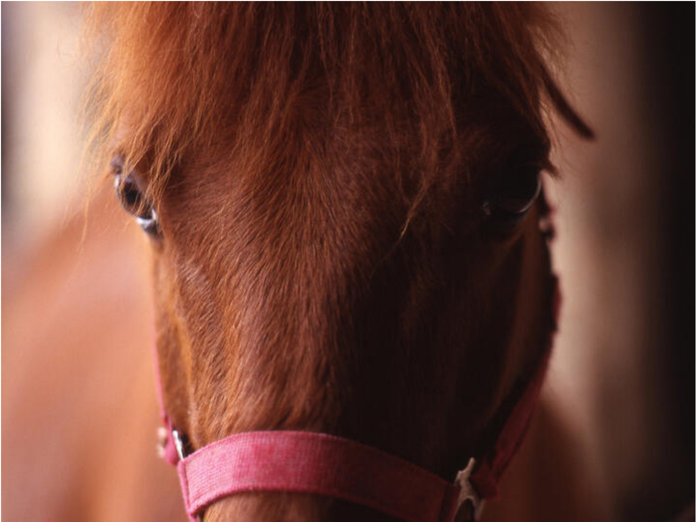
Rallye Halloween 38160 Saint-Vérand jeu. 29 oct.